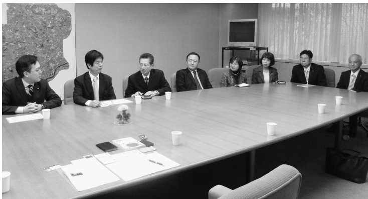
杉ひさたけ参議院議員（左）と新公会計制度について語り合う公明党吹田市議会議員団

「住民サービスのコストと負担とを あわせて明示することにより、市民 も職員もコスト意識が高まる」 その後も公明党吹田市議会議員団